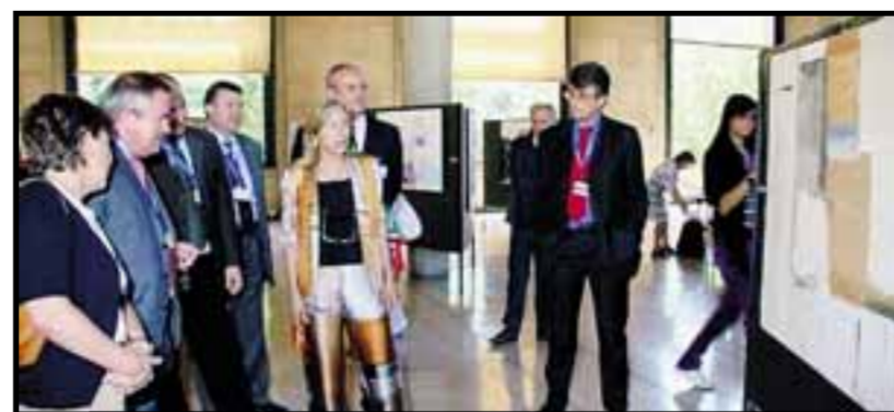
Sopra, la presentazione della mostra a Parigi. A fianco, una delle opere

Il Premio Agazzi, concorso nazionale di pittura, acquerello e grafica organizzato dall'Associazione culturale «Agazzi Ars» di Mapello, dal 2 giugno fino a ieri è stato in mostra al Palais Iena di Parigi a rappresentare la cultura italiana durante i lavori dell'Assemblea plenaria dell'Unione Europea Occidentale. In mostra una selezione di 30 opere realizzate appositamente per l'occasione dagli artisti italiani più rappresentativi che hanno partecipato alle 25 edizioni del concorso. Con un riferimento suggestivo al fautore del Premio, il pittore Ermenegildo Agazzi, Palais Iena, infatti, che oggi ospita il Consiglio economico e sociale della Repubblica Francese, fu costruito per ospitare mostre e opere in