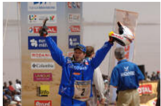
Cyril Despres si gusta la vittoria al termine di una gara ricca di tensione e colpi di scena come la Dakar 2007.