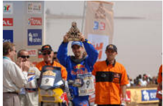
L'americano Chris Blais, terzo classificato.

"Come sempre la Dakar è molto, molto dura" ha commentato "oltre alla grande prestazione di Despres, Casteu e Blais sono molto soddisfatto anche della performance della nostra moto, la 690 Rally. Vorrei estendere i miei complimenti e i miei ringraziamenti a ogni singolo membro del team KTM, tutti hanno messo una dedizione e una passione esemplari nello svolgere un lavoro durissimo."